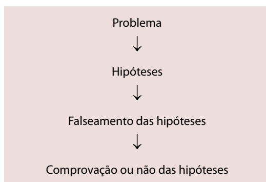
Figura 1 – Passos de utilização do método hipotético-dedutivo.

[...] na construção de conjecturas, as quais deveriam ser submetidas a testes, os mais diversos possíveis, à crítica intersubjetiva e ao controle mútuo pela discussão crítica, à publicidade crítica e ao confronto com os fatos, para ver quais as hipóteses que sobrevivem como mais aptas na luta pela vida, resistindo às tentativas de refutação e falseamento.